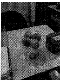
WhatsApp Image 2021-07-28 at 10.58.35.jpeg