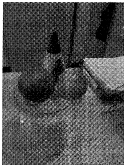
WhatsApp Image 2021-07-28 at 10.58.35(1).jpeg