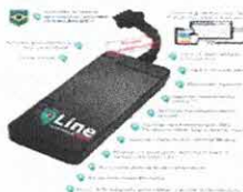
Mini Rastreador Bloqueador Veicular 4g...