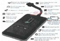
Mini Rastreador Veicular Gps Like Tracker 4g Sem...