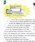
Mini Rastread Like Tracker 4