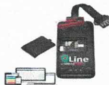
Mini Rastreador Veicular - GPS [Promoção] no...